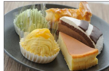
ケーキ各種 400円(1個) デザートの定番。