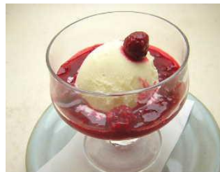
ラズベリーアフォガート 冷たいバニラアイスに温かいラズベリーソースをかけてお召し上がりください。