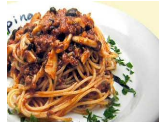
きのこのミートソース 魚沼産マイタケ、ブナシメジ、エリンギと自家製ミートソースのスパゲッティー。