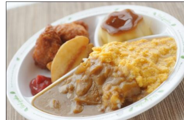
お子様ランチ 800円 甘口カレーにポテト、カラ揚げ、プリンがついた、お子様ランチ。