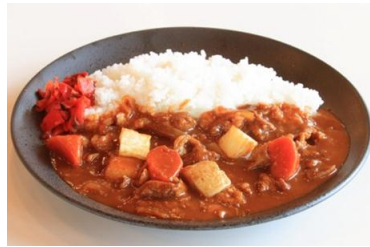
ハヤシDEカレー 1,000円 ハヤシとカレーが絶妙コラボ！新感覚の味わいが楽しめます。