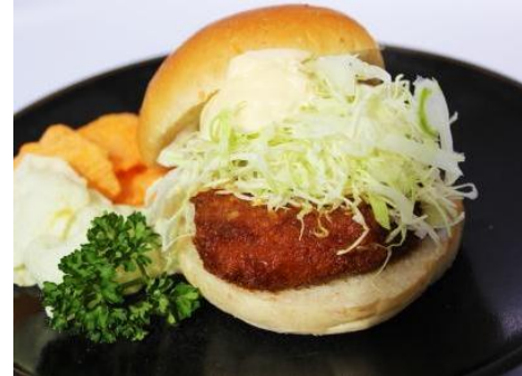
メンチカツバーガー 800円 メンチに地元特産の越後もち豚を使用。