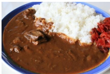
中辛ビーフカレー 900円 長時間に込んだ中辛の特製ビーフカレー。