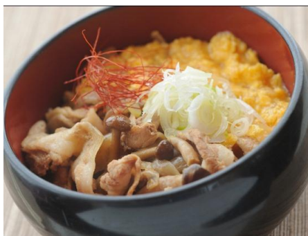
越後もち豚丼定食 越後もち豚をきのこことじっくり煮込んだ一品。