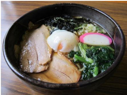
温玉しょうゆラーメン 温泉たまご入り しょうゆラーメン。