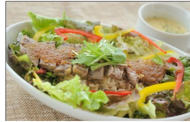
ステーキ野沢菜チャーハン 1,300円 国産牛のやわらかステーキとチャーハン風にアレンジした野沢菜ガーリックライスの相性は抜群！