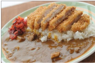
もち豚カツカレー 1,300円 特製ビーフカレーの上に越後もち豚カツをのせたカレー。