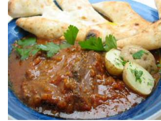
牛肉の赤ホワイトソース煮込み 国産牛肉をイタリア産赤ワインでじっくり煮込みました。自家製パン付き。