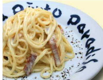
カルボナーラ イタリア産ベーコンと生ハム、地鶏卵、グラナチーズ、生クリームのスパゲッティー。