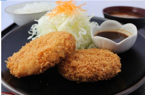
越後もち豚コロッケ定食 1,000円 の越後もち豚を使用した、メンチカツとコロッケのセットです。最初はソースをかけないで素材をお楽しみください。

営業期間 12月19日(金)～3月31日(火)全席禁煙 営業時間 9:00～16:00 (ドリンク) 11:00～15:00 (フード)