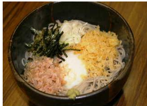
湯の花そば 温泉たまご、揚げ玉のシンプルなおそばです。