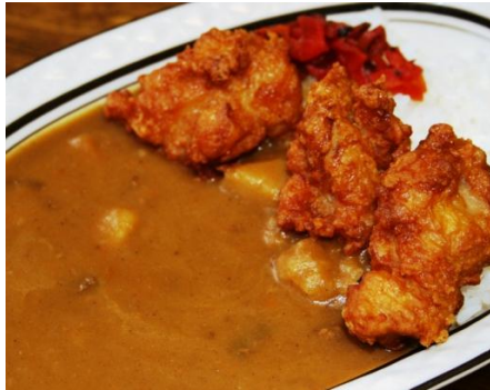
から揚げカレー 甘口のビーフカレーです。