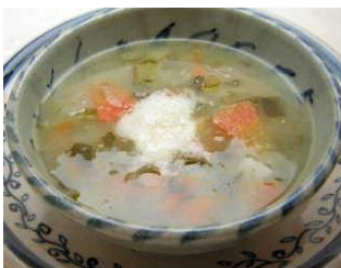
ミネストローネ たっぷりの自家製野菜と国産牛と豚肩ロースを煮込んで作ったスープです。