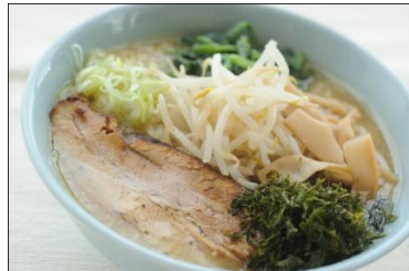
特製味噌ラーメン 850円 自家製とろとろチャーシューもたまらない味噌ラーメンです。