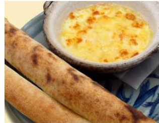
窯焼きチーズ おすすめ5種のチーズの窯焼き。ピザ生地の窯焼きパンにつけてどうぞ。