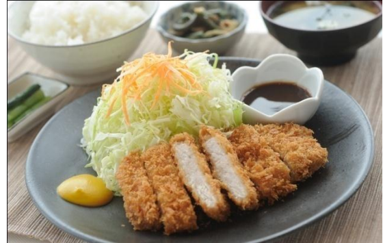
越後もち豚ロースカツ定食 1,300円 湯沢高原の名物料理が復活。あぶらがのっていてやわらかい食感が特徴のおいしい越後もち豚。