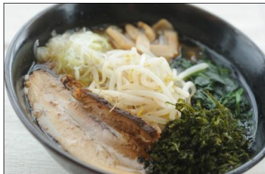
特製醤油ラーメン 850円 あっさりした醤油味に特製鶏ガラスープでコクを追加。