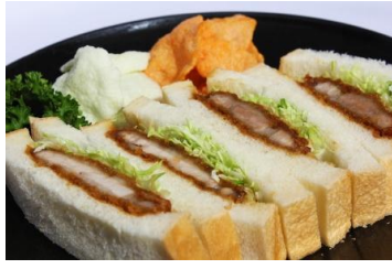
カツサンド 800円 越後もち豚を使用したカツサンド。