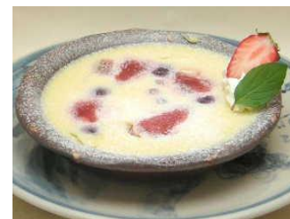
ベリーフロマージュ 中にクリームチーズ、ラズベリー、ブルーベリーが入ったオリジナルプリンです。