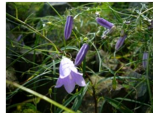
ホウオウシャジン