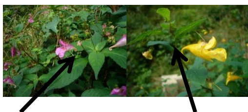
「葉の上」に花が付く

ボブスレーのゴールとスタートを結ぶ「やまびこリフト」今日は皆さんにこのリフト乗車中の楽しみ方を伝授いたします!!このリフトは山の合間を縫うように上がっていきます。そのためちょっと視界が狭く「うっわ～、眺め最高!!」とまではいかないかもしれません(T_T)。でもそんなときは周りの木やリフトの線下に目を向けてください。様々な植物があることに気づいてもらえます!!自生している花や樹木には名札を付けています。リフト乗車中に是非探してみてくださいね!!