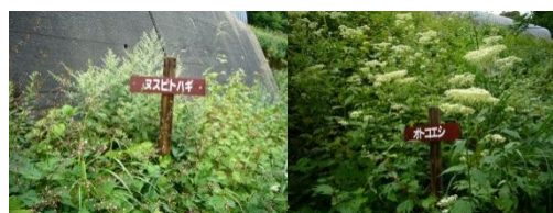
「葉の下」に花が付く

線下では今ツリフネソウやヌスビトハギ、オトコエシなどの花が咲いています。オトコエシ以外は色は濃いですが小さい花が多いので看板を頼りに探してみてくださいね!