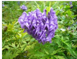
タイセツトリカブト