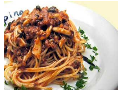
きのこのミートソース 1,520円(税別) 魚沼産マイタケ、フナシメジ、エリンギと自家製ミートソースのスパゲッティ。