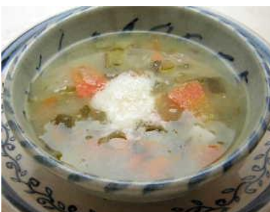
ミネストローネ 470円(税別) たっぶりの自家製野菜と国産牛と豚肩ロースを煮込んで作ったスープです。グラナーチーズ入り。