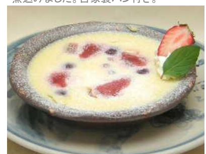
ベリーフロマージュ 570円(税別) 中にクリームチーズ、フレッシュイチゴ、ベリーが入ったオリジナルプリンです。