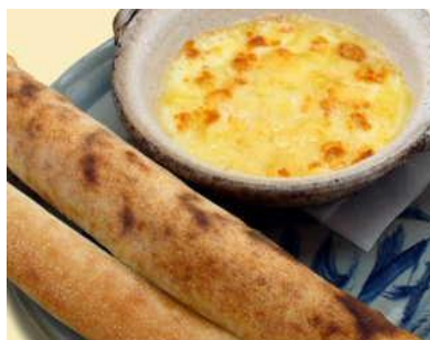
窯焼きチーズ 1,680円(税別) おすすめ5種のチーズの窯焼き。ピザ生地の窯焼きパンにつけてどうぞ。