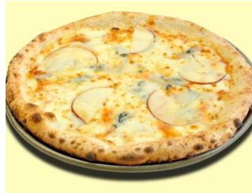
ゴルゴンゾーラ 2,620円(税別) 「イタリア産ゴルゴンゾーラチーズのアルピナオリジナルピッツァです。」