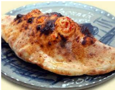
カルツォーネ 1,820円(税別) ロースハムとモッツアレラチーズの包み焼きピッツァ。