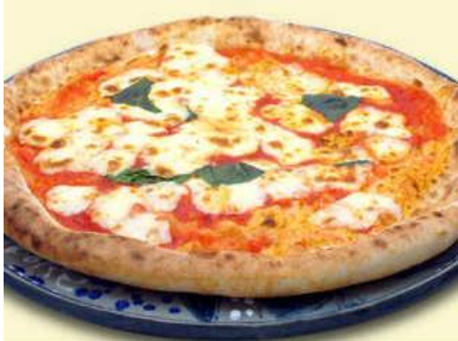
マルゲリータ 1,620円(税別) イタリア産トマト4種のブレンドソースとチーズ、バジルのベーシックタイプ。