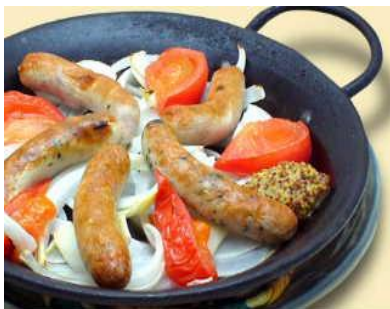
窯焼きソーセージ 1,570円(税別) ハーブ入り行者ニンニク入りの2種類のポークソーセージの窯焼き。