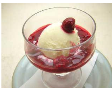
ラズベリーアフォガード 680円(税別) 冷たいバニラアイスに温かいラズベリーソースをかけてお召し上がりください。