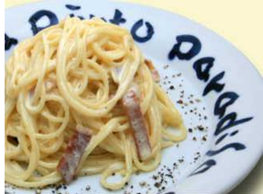
カルボナーラ 1,720円(税別) イタリア産ベーコンと生ハム、地鶏卵、グラナーチーズ、生クリームのスパゲッティ。