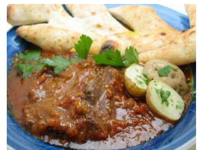
牛肉の赤ワイントマトソース煮込み 2,200円(税別) 国産牛肉をイタリア産赤ワインでじっくり煮込みました。自家製パン付き。