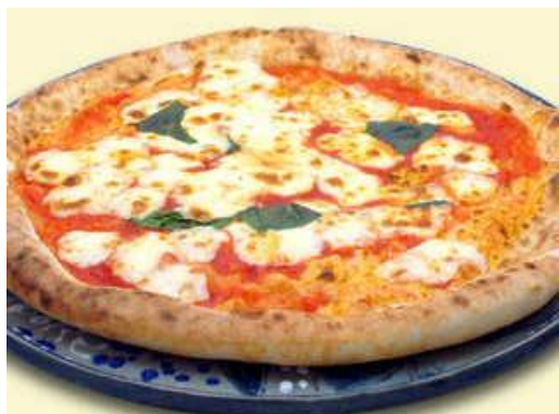
マルゲリータ 1,620円(税別) イタリア産トマト4種のブレンドソースとチーズ、バジルのベーシックタイプ。