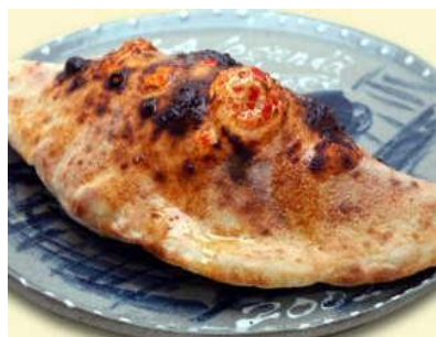
カルツォーネ 1,820円(税別) ロースハムとモッツアレラチーズの包み焼きピッツァ。