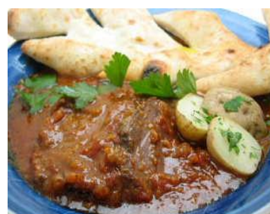
牛肉の赤ワイントマトソース煮込み 2,200円(税別) 国産牛肉をイタリア産赤ワインでじっくり煮込みました。自家製パン付き。