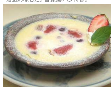
ベリーフロマージュ 570円(税別) 中にクリームチーズ、フレッシュイチゴ、ベリーが入ったオリジナルプリンです。