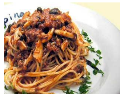
きのこのミートソース 1,520円(税別) 魚沼産マイタケ、フナシメジ、エリンギと自家製ミートソースのスパゲッティ。