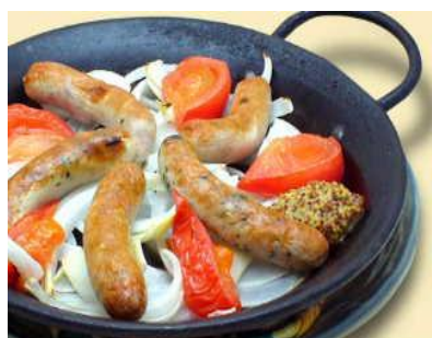
窯焼きソーセージ 1,570円(税別) ハーブ入り行者ニンニク入りの2種類のポークソーセージの窯焼き。