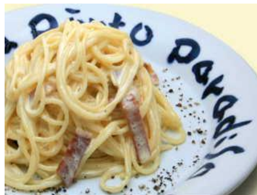
カルボナーラ 1,720円(税別) イタリア産ベーコンと生ハム、地鶏卵、グラナパチーズ、生クリームのスパゲッティ。