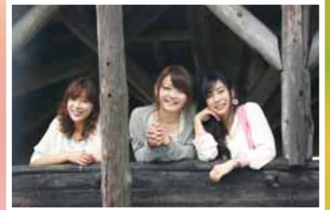
第22回 スナップの部 最優秀賞 「麗しき乙女たち」 浜田一弘