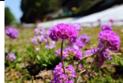
タマザキサクラソウ