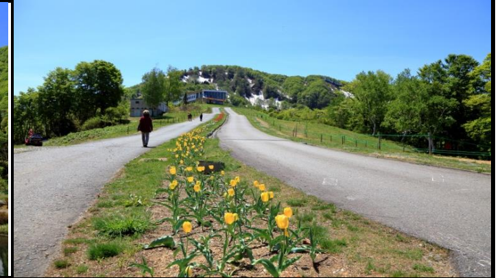
パノラマステーション

サマーボブスレー側は残雪のため通行できません。 一部でミズバショウ、タマザキサクラソウ、シラネアオイ、雪割草がご覧いただけます。