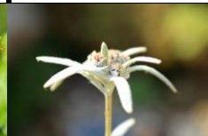
ハヤチネウスユキソウ