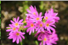
ミチノクコザクラ