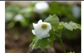
白花シラネアオイ

お知らせ 残雪が消え次第、順次立ち入り制限を解除いたします。トレッキングコースは園内、園外とも残雪のため当分の間通行止めです。