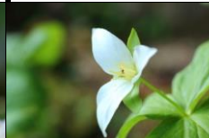
オオバナエンレイソウ