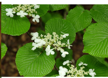
ムシカリ(オオカメノキ)