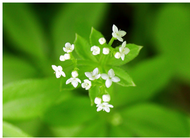
オククルマムグラ