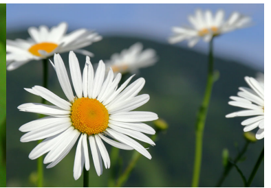
シャスターデージー