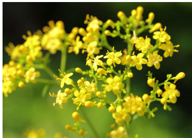
ハクサンオミナエシ