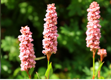
洋種ナンブトラノオ