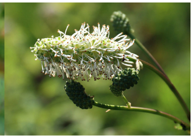
シロバナトウウチソウ