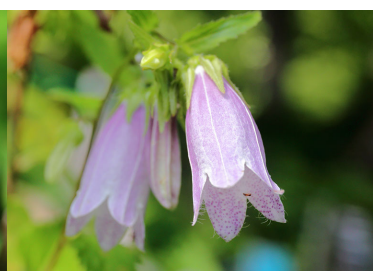
ヤマホタルブクロ