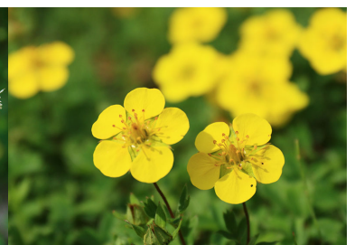
メアカンキンバイ