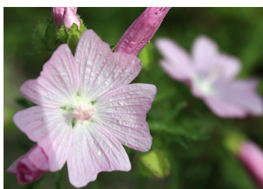
モモイロジャコウアオイ