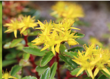
テカリダケキリンソウ