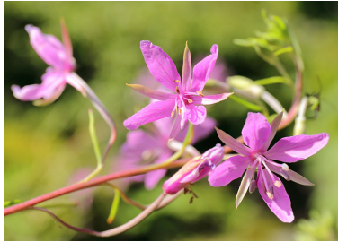
セイヨウハナシノブ