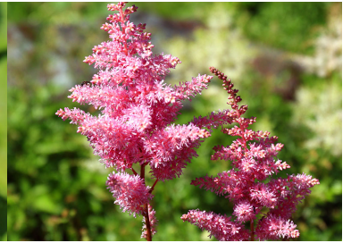
ウンナンショウマ