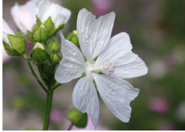
白花ジャコウアオイ