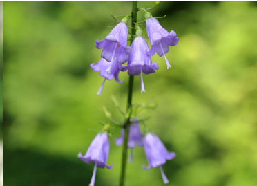
ツリガネニンジン