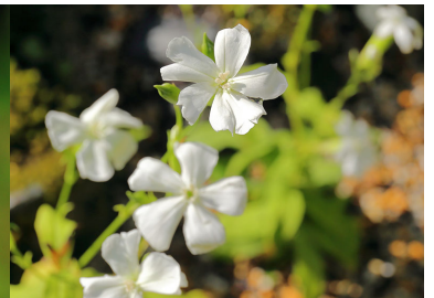
フシグロセンノウ(白花)