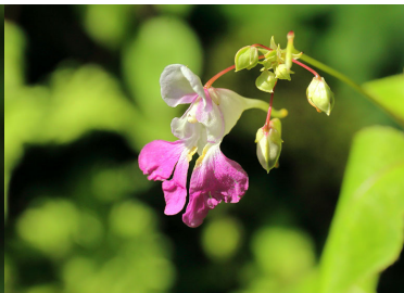
ハナツリフネソウ