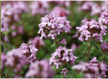
イブキジャコウソウ