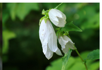
ヤマホタルブクロ(白花)