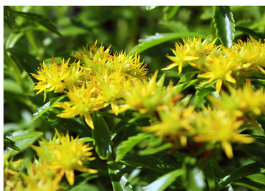
ホソバキリンソウ