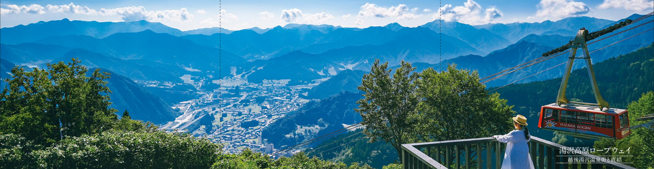
湯沢高原ロープウェイ 越後湯沢温泉街と直結

世界最大級166人乗りロープウェイで7分 標高約1,000mの高原へ 高山植物・アクティビティ・グルメと清々しい高原でお過ごしください