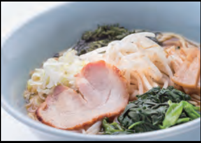
特製みそラーメン Miso Ramen - Bean paste soup noodles ¥1,100