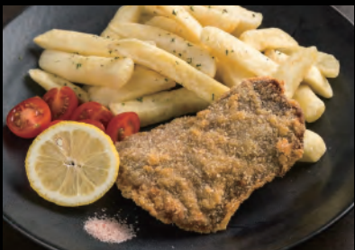
新潟県産牛のコルドンブルー Niigata beef Cordon bleu ¥1,800