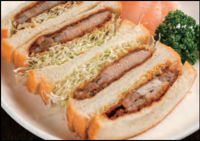
新潟県産豚のカツサンド Pork cutlet Sandwich ¥1,200