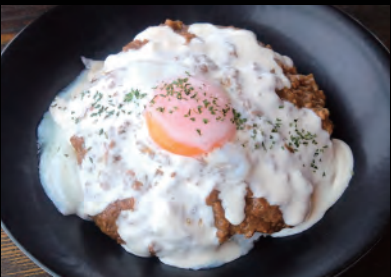
雪山キーマカレー Minced meat curry with cheese sauce ¥1,500