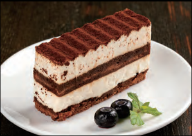
ティラミス+ソフトドリンク Tiramisu cake + Soft drink ¥1,000