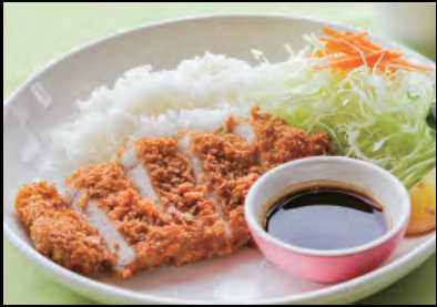
越後もち豚カツプレート Pork cutlet plate ¥1,600