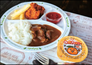
お子様カレー Kids Curry platter ¥900