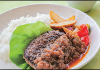
ハンバーグプレート(和風おろし) Hamburger steak plate with grated radise ¥1,600