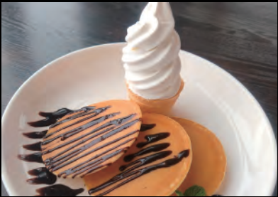
ソフトクリームパンケーキ Soft serve ice cream pancake ¥1,000