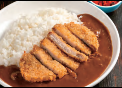
新潟県産豚のカツカレー Pork cutlet curry & rice ¥1,600