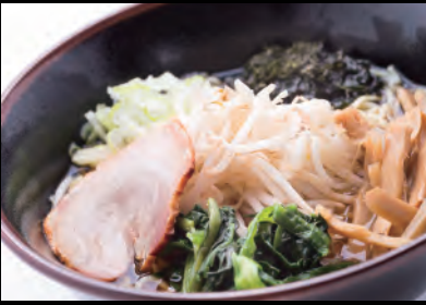
特製醤油ラーメン Shoyu Ramen - Soysauce soup noodles ¥1,100