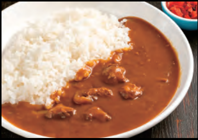
新潟県産豚のマイルドカレー Pork curry & rice ¥1,100