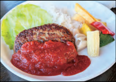
ハンバーグプレート(トマトガーリック) Hamburger steak plate with tomato garlic ¥1,600