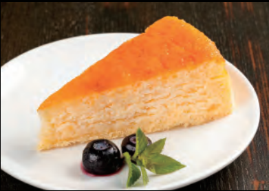
チーズケーキ+ソフトドリンク Baked cheese cake + Soft drink ¥1,000