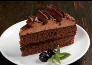
ショコラ+ソフトドリンク Chocolate cake + Soft drink ¥1,000