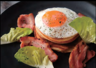
ベーコンエッグパンケーキ Bacon egg pancakes ¥1,000