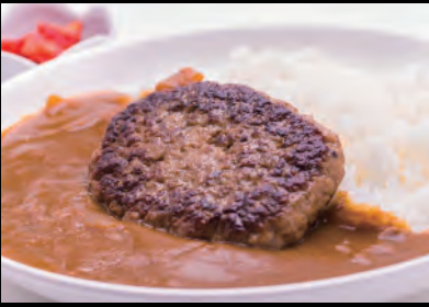
ハンバーグカレー Hamburger steak curry & rice ¥1,600