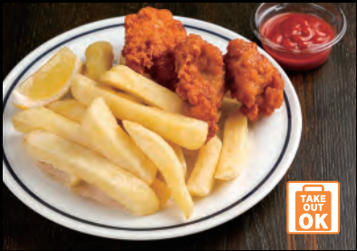
ポテカラセット French fries&Fried chicken ¥800