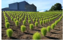
山頂パノラマステーション前 コキア