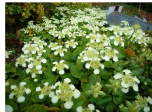
シラヒゲウメバチソウ