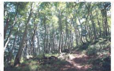
一楠場ルートの景観