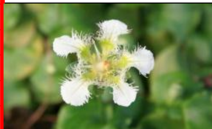
シラヒゲウメバチソウ