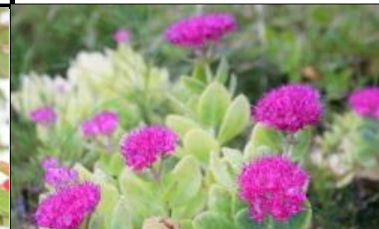
オオベンケイソウ